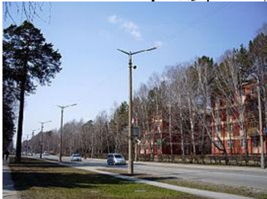
Морской проспект в Академгородке