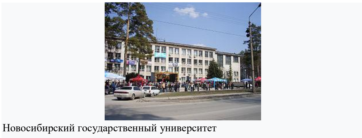
Новосибирский государственный университет

В августе 2006 года принято решение о строительстве в Академгородке технопарка стоимостью 17 млрд рублей (затем ровно через год оценочная стоимость была увеличена и достигла 21 736,63 млн рублей). Технопарк будет построен в рамках государственной программы «Создание в Российской Федерации технопарков в сфере высоких технологий» [5] и будет специализироваться по четырём основным направлениям: информационные технологии, медико-биологические технологии, силовая электроника и приборостроение. Территория технопарка составит 100 гектаров. Планируется, что общая площадь научно-производственных помещений составит около 150 тыс. м 2 . Помимо них, будет введено множество вспомогательных площадей, построены офисные и торговые центры, жилые комплексы. Строительство технопарка должно было начаться в сентябре 2007 года, и первую очередь планировалось завершить в течение двух лет [6] . Согласно заявлению бывшего председателя СО РАН Николая Добрецова, строительство началось 29 ноября 2007 года [7] . В то же время проект технопарка вызвал протесты части жителей Академгородка, обеспокоенных возможными экологическими последствиями планируемого